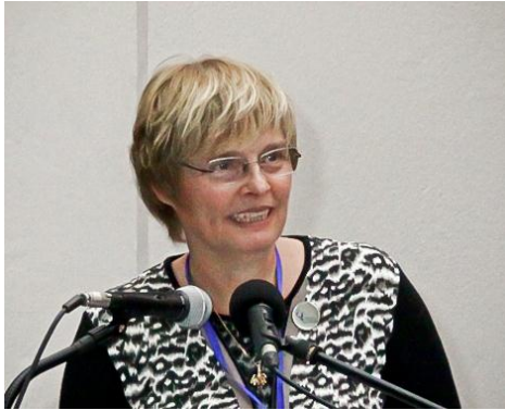
Honorary President and Founder